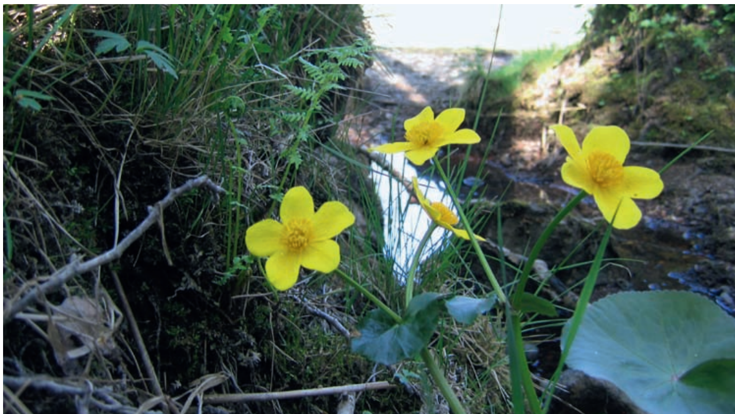
Kabbelekan är vanlig vid vatten.